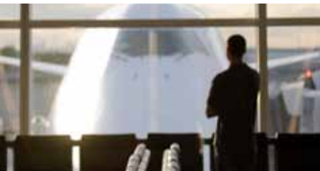
Aeropuertos y puertos