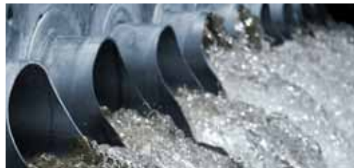
Agua y Tratamiento de Agua