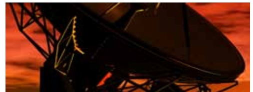
Infraestructura para telecomunicaciones